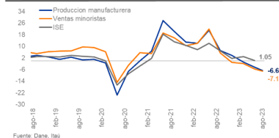
Colombia: Crecimiento trimestral de la actividad (SA)

El miércoles se publicará el indicador de seguimiento económico (ISE) de agosto. En julio, el indicador de actividad coincidente (ISE) cayó 0,7% de junio a julio (SA), muy por debajo del +1,1% de junio y lo que llevó a una expansión interanual de 1,2% (1,7% en junio). En general, la actividad se sitúa un 8,9% por encima de los niveles previos a la pandemia (frente a un máximo del 10,3% a principios de este año). Para agosto, esperamos una expansión interanual del 0,3%, impulsada por los servicios, pero contrarrestada por los sectores de manufactura, construcción y comercio. Esperamos un crecimiento de la economía del 1,0% en 2023.