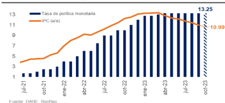
Colombia: Inflación y tasa de interés (%)

El martes, el BanRep celebrará su reunión de política monetaria. En septiembre, la Junta optó por mantener las tasas en 13,25%, pero dos de los siete miembros estaban a favor de un recorte de 25 puntos básicos. Para la reunión del martes, esperamos que la tasa se mantenga en 13,25%, aunque con una junta nuevamente dividida con el ministro Bonilla apoyando un recorte de tasa. El jueves, BanRep publicará su informe de política monetaria del tercer trimestre, el cual debería brindar más información sobre el escenario macroeconómico. Por último, el viernes se conocerá las minutas de la reunión de política monetaria de octubre.