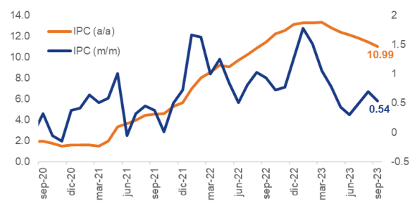
Colombia: Inflación y tasa de interés (%)

El miércoles, el DANE publicará el IPC de octubre. La inflación aumento 0,54% de agosto a septiembre (0,95% en septiembre de 2022), en línea con las previsiones del mercado. La inflación anual cayó al 10,99% (desde el 11,43% en agosto), mientras que la inflación subyacente cayó del 10,09% al 9,80% (un máximo del 10,60% en abril). Para octubre, esperamos un aumento mensual del 0,38% (0,54% mensual en septiembre; 0,72% un año antes), impulsado por los precios de la vivienda y los alimentos. En términos anuales, la inflación se moderaría hasta el 10,61%, frente al 10,99% de septiembre (el pico de marzo fue del 13,34%).